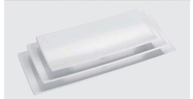
Haushaltsartikel aus Melamin-Kunststoffen